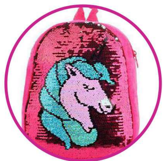
РЮКЗАЧКИ И СУМОЧКИ