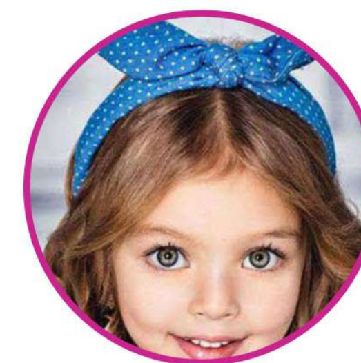
АКСЕССУАРЫ ДЛЯ ВОЛОС